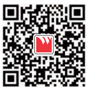
工程饰材官方微信