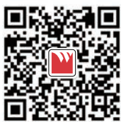
工程台面官方微信